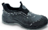
FLEXILE PLUS ptp 55 SEGURIDAD