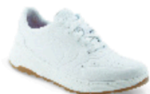
DUNA pág. 1 SANIDAD/HOSTELERÍA