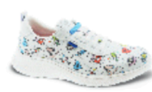
ALTEA PLUS ESTAMPADO pág. 5 SANIDAD