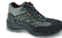
CAIRO ptp 51 SEGURIDAD