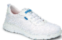
ATLANTA pág. 3 SANIDAD/HOSTELERÍA