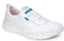
ALICANTE pág. 2 SANIDAD/HOSTELERÍA