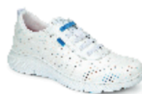
ALTEA PLUS pág. 4 SANIDAD/HOSTELERÍA