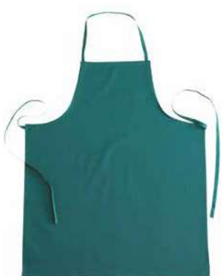
04 - VERDE 04 - GREEN