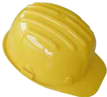
08 - GIALLO 08 - YELLOW

Elmetto 100% polietilene, peso 350 g compreso di bardature a 6 cardini con regolazione nucale, predisposto per attacco cuffia, isolamento elettrico 440 V.