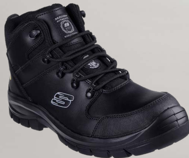
REF. SK200187EC TROPHUS - PENDING