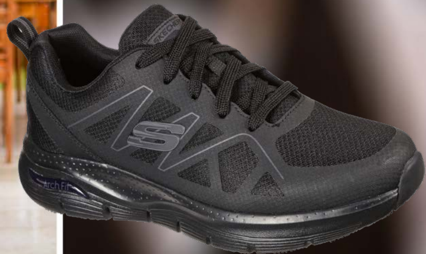
SK200025EC ARCH FIT SR - AXTELL