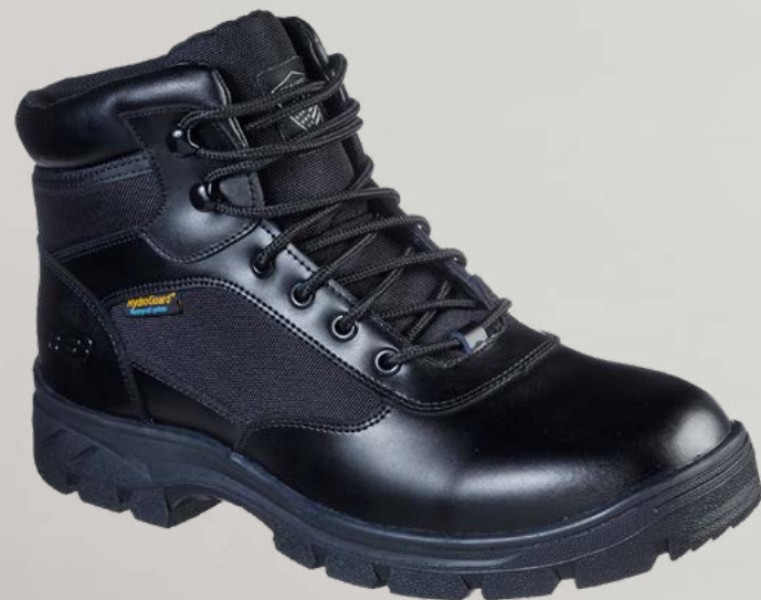
REF. SK77526EC WASCANA - BENEN WP