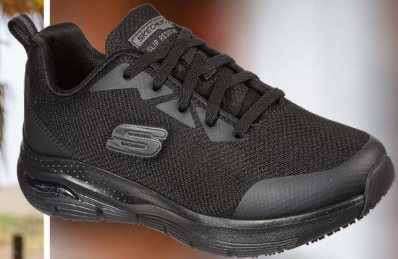
SK108019EC ARCH FIT SR