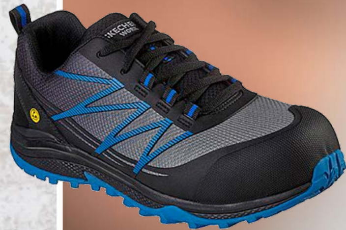
REF. SK200046EC PUXAL COMP TOE