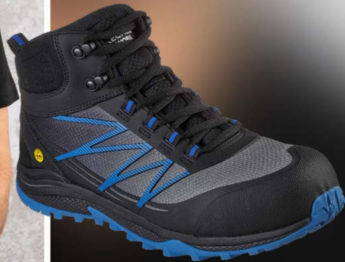
REF. 200047EC PUXAL FIRMLE