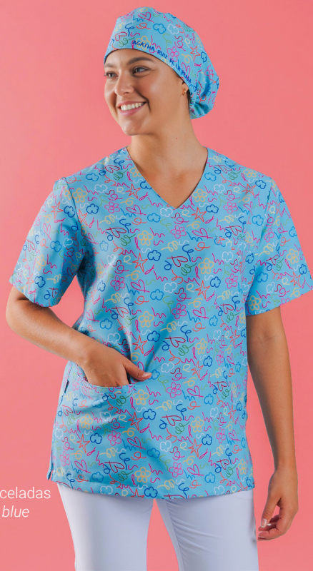
c/5153 Pinceladas Pinceladas blue