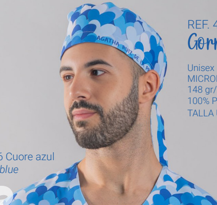
c/5146 Cuore azul Cuore blue

Unisex MICROFIBRA/MICROFIBRE 148 gr/m 2 100% PES TALLA ÚNICA/ONE SIZE