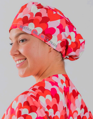
c/5147 Cuore rojo Cuore red

Unisex MICROFIBRA/MICROFIBRE 148 gr/m 2 100% PES TALLA ÚNICA/ONE SIZE