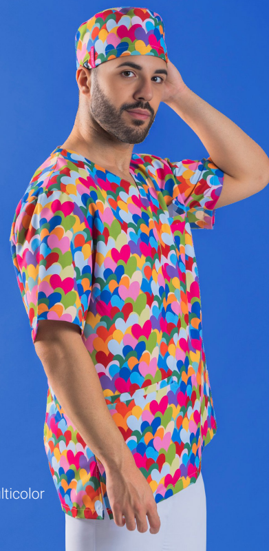
c/5149 Cuore multicolor