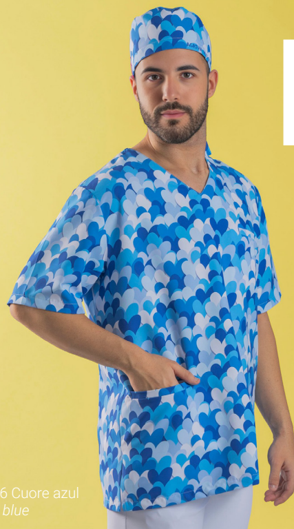
c/5146 Cuore azul Cuore blue