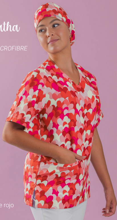
c/5147 Cuore rojo Cuore red

Unisex MICROFIBRA/MICROFIBRE 148 gr/m 2 100% PES XS-XXL