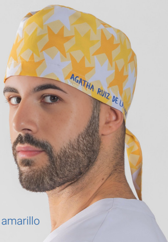
c/5151 Cometa amarillo Cometa yellow