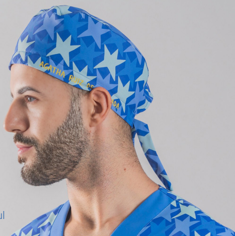
c/5152 Cometa azul Cometa blue

Con tejido absorbente para sudoración en el frontal interior.