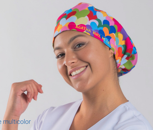
c/5149 Cuore multicolor